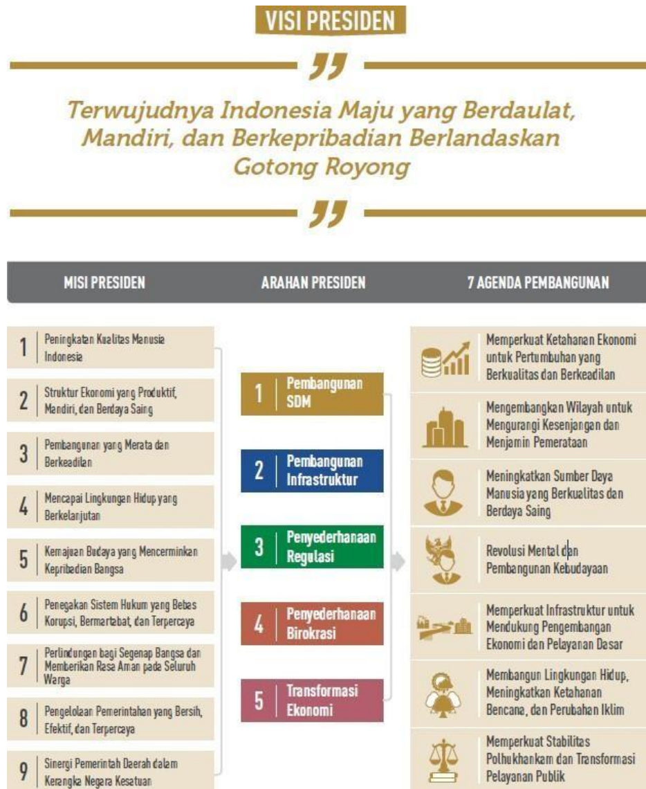
Gambar 3.1 Visi, Misi, Arah-an Presiden dan Agenda Pembangunan Nasional Tahun 2020-2024